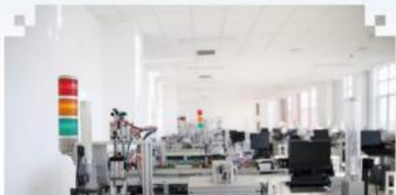
自动化生产线安装与 调试训练场所