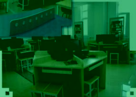
一体化课程教学设计 综合实训室