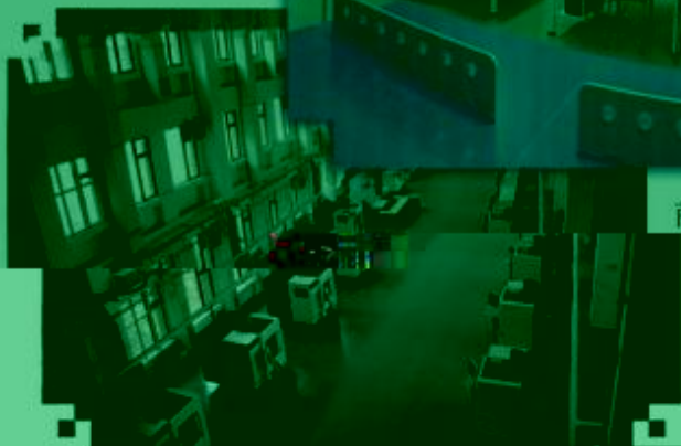
DMG 数控技术 训练场所